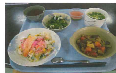
行事食(ちらし寿司)