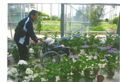
外出レクリエーション